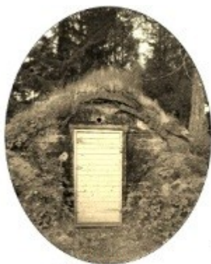
Hyddans Zon och Gärd

Alt 3 Triss i Vätternfisk Gravad Lax med Hovmästarsås, Rökt Regnbåge, Rökt Vätternsik med örtagårdssås, potatis, potatissallad, grönsallad och kuvertbröd Kaffe och tårta 255 kr Dryck tillkommer